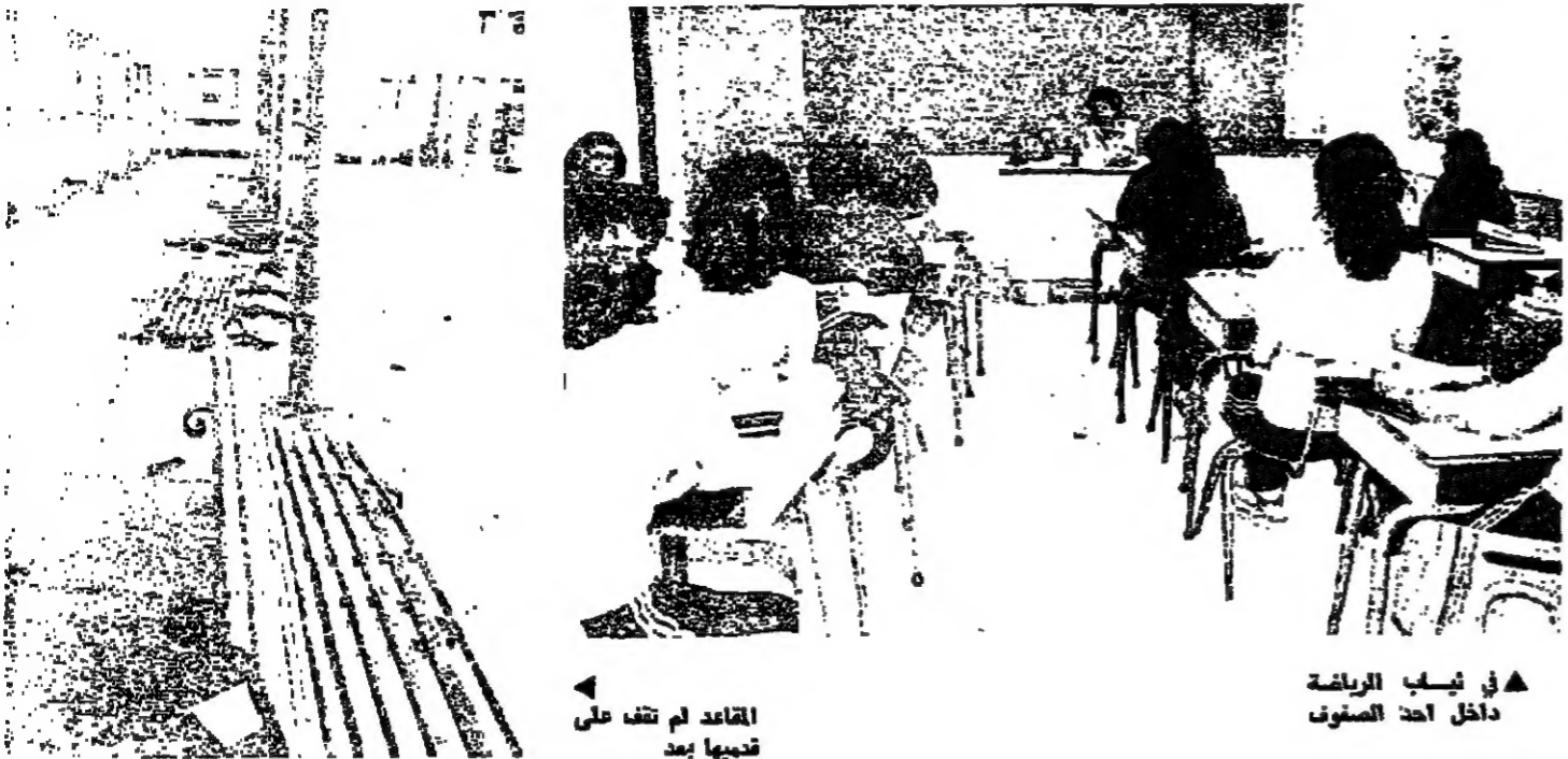
في ثياب الرياضة داخل أحد الصفوف